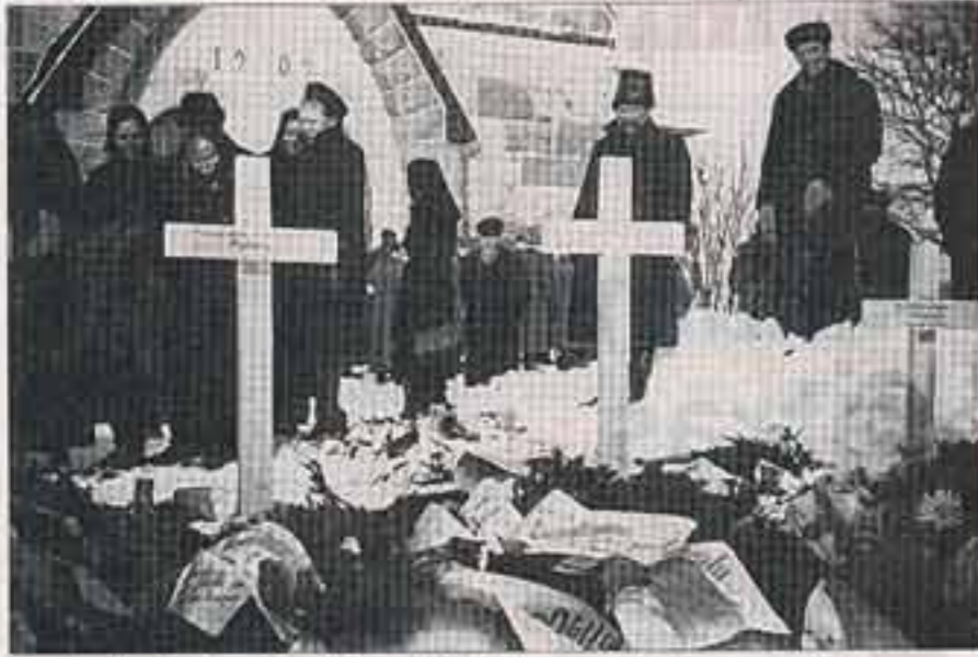
Sankarivainajan hautajaiset Pyhärannan hautausmaalla.