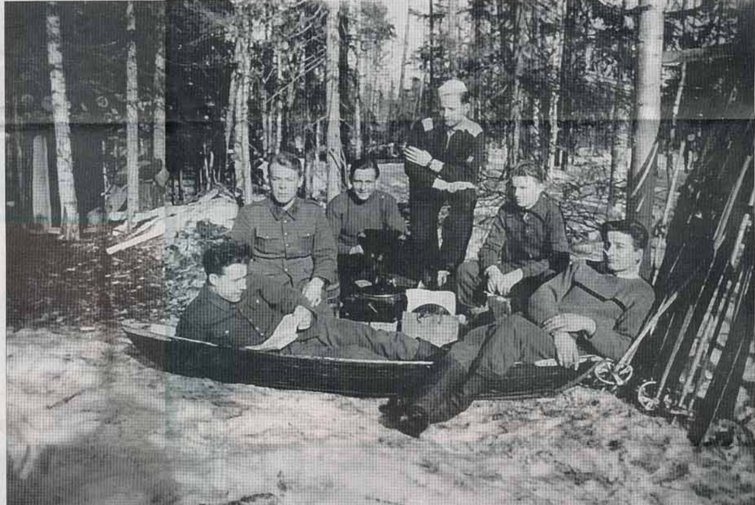
Pyhärannan miehillä on leppoisa hetki metsässä gramofonia kuunnellessa. Kirjoittajan isä toinen vasemmalla, muiden henkilöilysydestä ei ole tietoa.

Lokalahdella ja Pyhämaassa keräys on edennyt kaikkein pisimmälle. Myös Pyhärannassa on edistytty erinomaisesti. Vehmaalla vasta aloitellaan. Kaikkein hankalinta tietojen saanti on Uudestakaupungista. – Keruun pohjana käytämme sota-arkistosta saatuja kutsuntalistoja. Niissä on aika paljon karsittavaa ja puutteita. Osa miehistä on muuttanut paikkakuntaa, osa puolestaan kuollut tai sairastunut jo ennen liike-