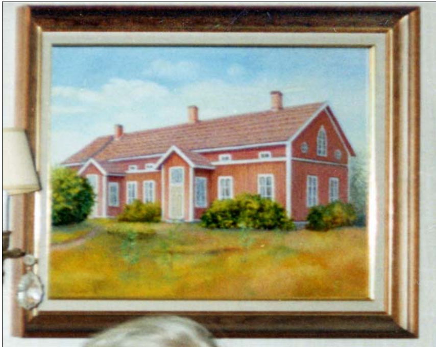
Uolan suvun hallussa oleva maalaus Perkkiön sodanaikaisesta päärakennuksesta. Talossa oli 14 huonetta ja sen seinäkirjessä oli merkittynä vuosiluku 1738.

Vuonna 2012 julkaistussa veteraanimatrikkelissa ”Lokalahtelaiset sodissa 1939-1945” kerrotaan tekstein ja kuvin myös kotirintaman elämästä. Lokalahdelle oli sijoitettu sekä sotavankeja että myös evakuoitusta Karjalasta tulleita evakkoja. Joissakin taloissa oli sijoitettuna myös lähiseudulta mm. Turusta tulleita talkoolaisia tai heitä, jotka olivat sotapakolaisia. Turku, kuten monet muutkin kaupungit olivat neuvostoilmavoimien pommituskohteina.