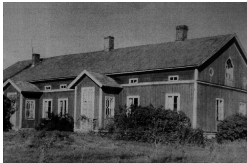
Vuonna 1970 purettu Perkkiön päärakennus oli sodan aikana tämän näköinen. Tilalla oli peltoa noin 20 hehtaaria ja metsää noin 100 hehtaaria.

4.-10.10 1943 Aili Simola Sirkkalankatu 2 B 4.-10.10.1943 Laila Huhtanen Sirkkalankatu 22 11.-23.10.1943 Helmi Suominen Kaarinankatu 2 B 30 11.-23.10.1943 Oili Siltanen Sirkkalankatu 6 A 11.-23.10.1943 Aili Siltanen (Nikander) Korppolaistentie 208 11.-23.10.1943 Elin Kairenius Sirkkalankatu 10 B.