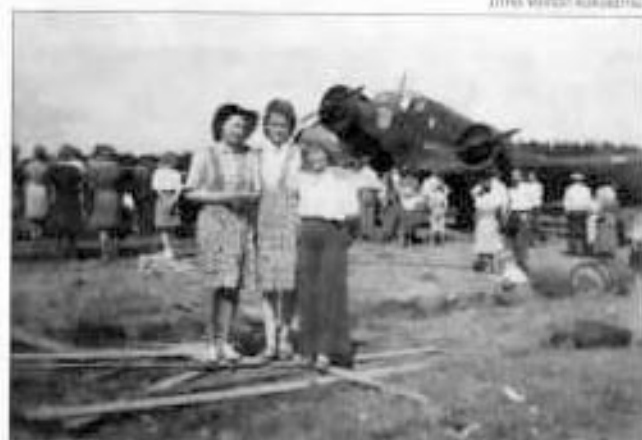
Heinäkuussa 1944 Pyhärannan Ilohodeen pakkolaskun tehnyt saksalaiskone kiinnosti pyhärantalaisia. Kirjan kuvitusta.